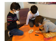
DES JEUX DE SOCIÉTÉ