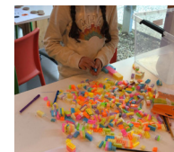
DES LOISIRS CRÉATIFS

A la ludothèque, les livraisons de jeux ont commencé ! L'occasion pour nos ludothécaires de l'extrême d'aller à la rencontre des adhérents et de maintenir le lien !