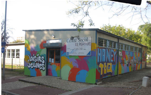
Le Centre Social Le Pertuis, avenue de Moscou en 2011... Une autre époque !