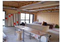
LES TRAVAUX DE L'AZIMUT