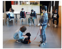
SUITE DE LA MÉDIATION CANINE